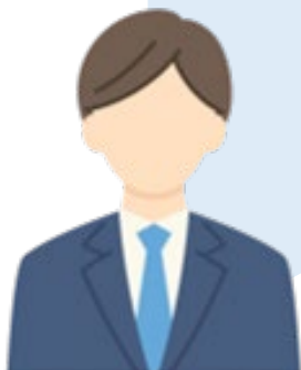
開発部 チームリーダー：Bさん