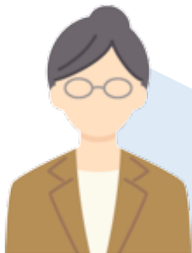
人事部：Aさん (システムも管理できる方)