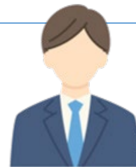
開発部 チームリーダー：Bさん