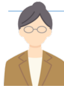
人事部：Aさん (システムも管理できる方)